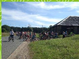
Pie Klapu kroga