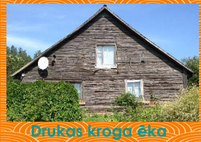
Drukas kroga ēka