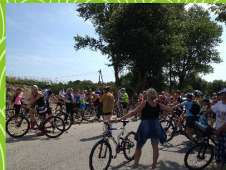
Kādreizēja Balku kroga vieta