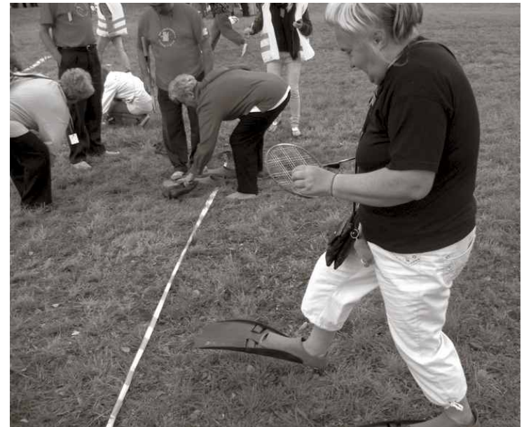
Uzmanību! Gatavību! Starts!