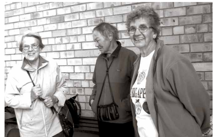
Senioru sporta spēlēs Ādažos labs garastāvoklis garantēts.