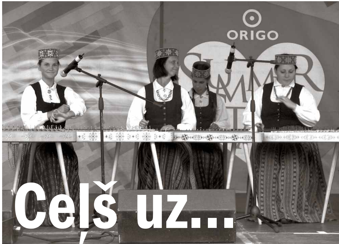
Baldones koklētājas pasākuma "Ceļš uz..." koncertā Stacijas laukumā

Nesen Latvijas galvaspilsēta Rīga svinēja savu 810. dzimšanas dienu. Nozīmīgās gadadienas ietvaros Rīgā notika daudz dažādu interesantu pasākumu, to starpā arī pasākums "Ceļš uz..."