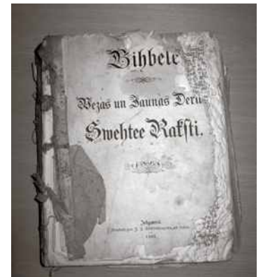
Vērtīgs dāvinājums – Bībele

Savukārt no "Avotnieku" mājām saņēmam Bibli "Svētie raks-