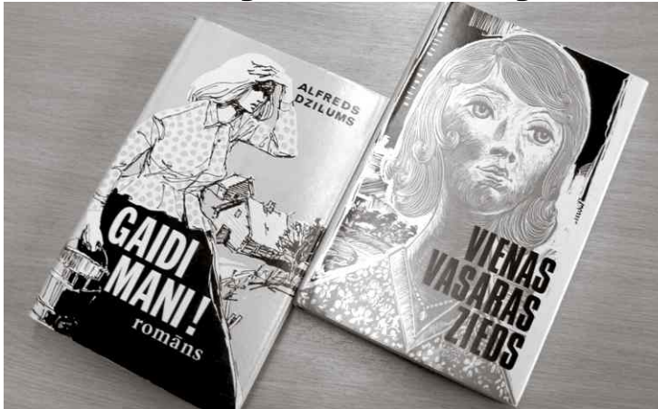
Alfrēda Dziļuma trimdā izdotie romāni