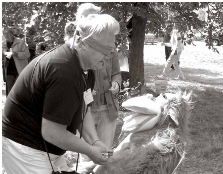
Izaicinājums ar pērtiķi