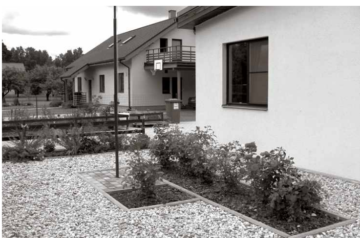
◀ Japāniski askētiskais akmens dārzs Ošu ielā