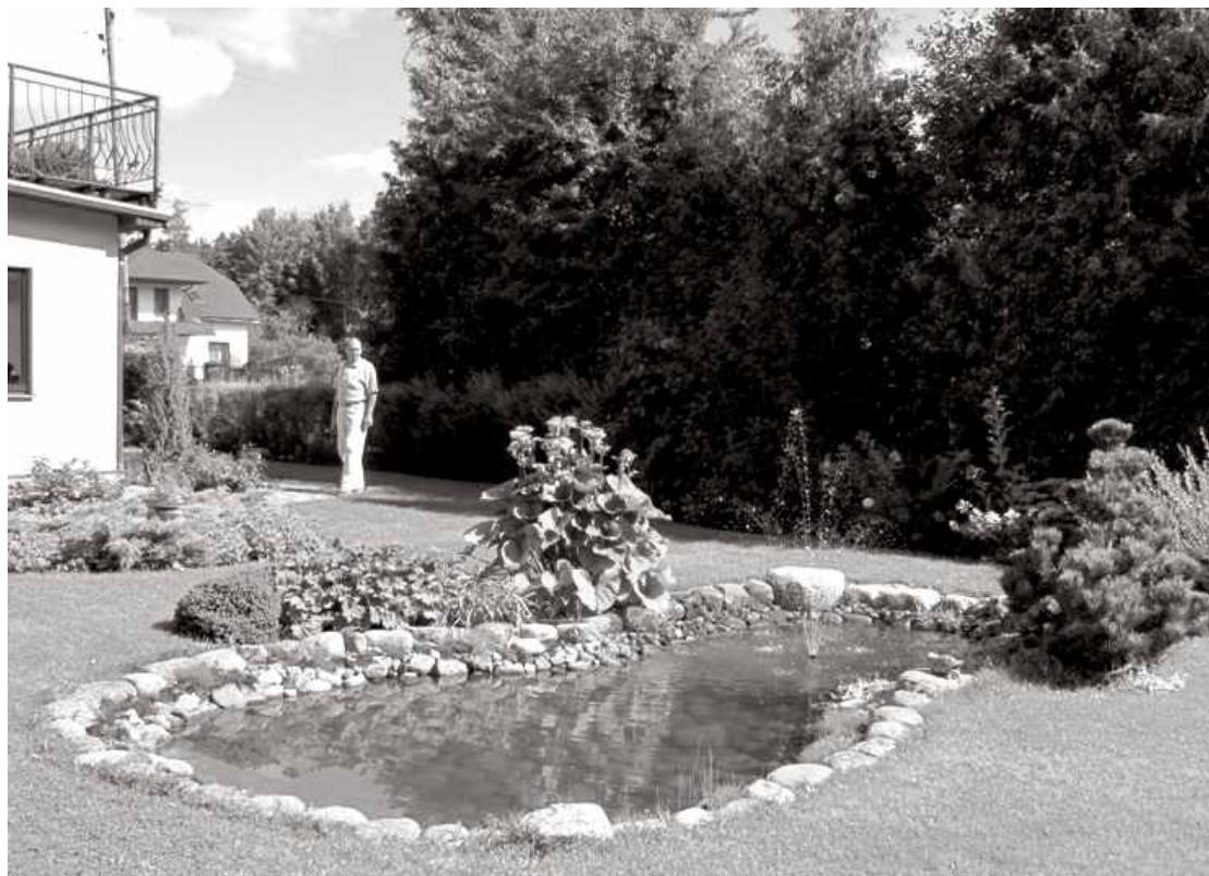
Dārza baseiniņš ar strūklaku saulainajā Daugavas ielā