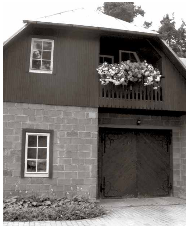
Begoniju mākoņi uz balkonu margām Pilskalna ielā ▶