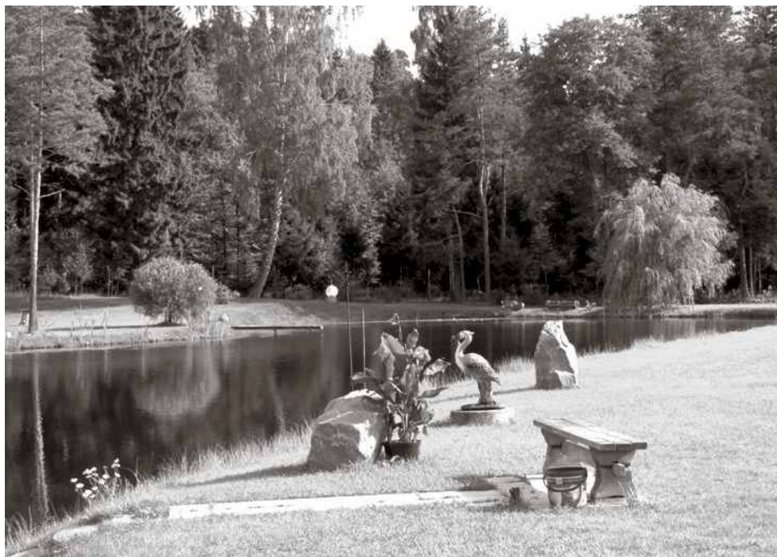
Skaistais un plašais ainavu dārzs Priēžu ielā