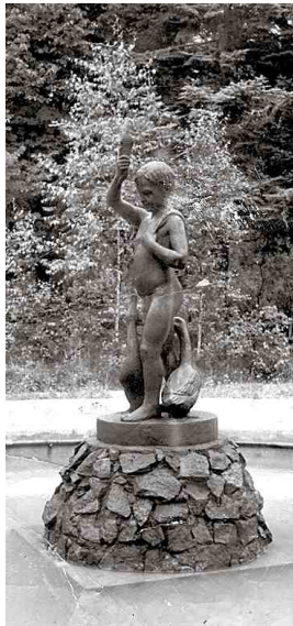
Slavenā strūklakas puisīša skulptūra pie pils

un citi nozīmīgi viesi, pasākumu filmēt ieradīsies arī televīzija. Taču pirmkārt tie būs svētki baldoniešiem, tāpēc ikviens ir miļi aicināts. Sīkāka informācija par svinībām būs atrodamā mūzikas pamatskolas vietnē – www.muzikasbaltapils.lv , Baldones novada tīmekļa vietnē – www.baldone.lv , kā arī pilsētā tiks izvietoti pasākuma plakāti.