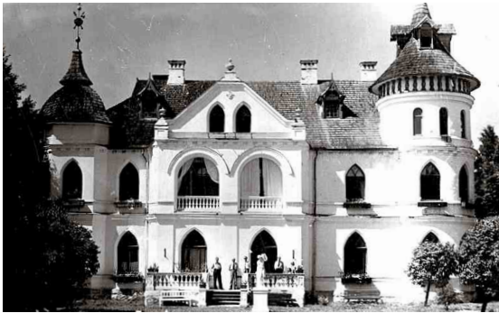
Baltā pils Latvijas brīvvalsts laikā, 20., 30. gadi, precīzi nav zināms